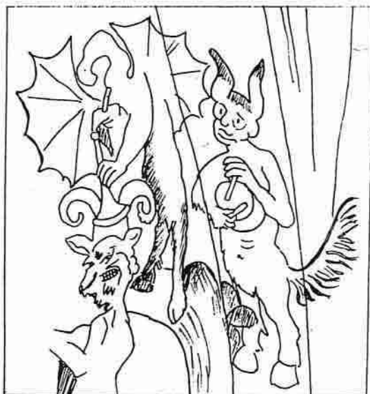
Yttersta domen. Detalj ur kalkmålning från 1462-63 i Strängnäs domkyrka.

ylanden kan möjligen också betecknas som dionysiska - om man bortser från de kommersiella drivkrafterna. Också musikinstrument kan man betrakta ur samma synvinkel. I medeltida, målade framställningar av yttersta domen kan de saligas vandring till himmelen beledsagas av musik, framförd på stränginstrument, såsom harpa, luta och fiddla. De osaligas färd - deras, som varit slavar under sina lustar och lidelser - mot avgrundsgapet kan däremot ackompanjeras av musik på trumma och säckpipa, som väl kan ses som en efterföljare till den grekiska aulos.