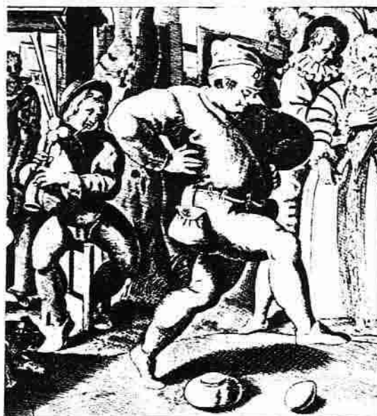
"Äggdansen" utförd till spel på säckpipa (och diverse husgeråd); 1500-talets andra hälft.

Något av denna och av annan grekisk spekulation levde alltså kvar under medeltiden och är bland annat orsaken till kyrkotonaternas grekiska namn: dorisk , frygisk , lydisk , mixolydisk och så vidare.