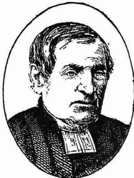
Arvid August Afzelius (1785-1871), själv prästson, var hovpredikant och kyrkoherde i Enköping.

längtan på något riktigt bra sätt. I Afzelius' dikt är det "havets kung" som sorgset spelar på sin harpa. Hans älskade, som av Oden själv förvandlats till en himmelsk stjärna, var fordom "en av jordens tärnor", som "skön och blyg" smög sina tjusande behag mot hans barm. Vemodsfyllt ser han nu sin älskade spegla sitt glänsande anlete i vattnet - möjligen är hon ingen mindre än kärleksgudinnan, Fröja , själv. Först efter ragnarök, när allt förlöses och jord och himmel tar ny gestalt, skall de åter möta varandra. Det är märkligt att se hur fornnordiska gudar och mytiska föreställningar passas in i den platonska tankevärld som egentligen präglar dikten. Det är också märkligt hur folkkära Näckens polska , Euphrosynes Vårvindar friska - också den diktad till en polskemelodi - Geijers ballad Den lille kolargossen , Tegnér's Frithiofs saga och andra romantiska dikter och diktverk kunde bli, den något egendomliga världsbilden till trots.