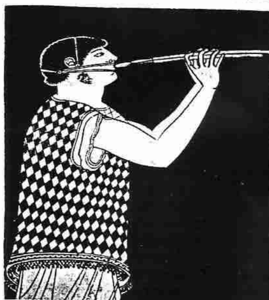
Aulosblåsare. Detalj från en grekisk vas målning, ca 480 f.Kr.