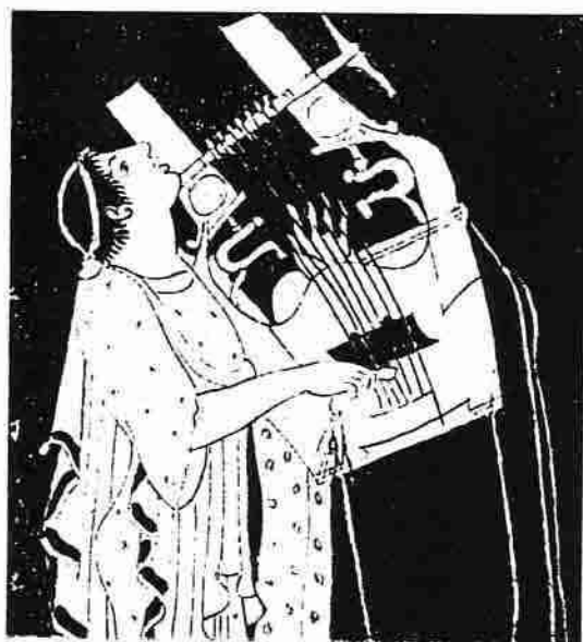
Kitharospelare. Detalj från en grekisk amfora, ca 480 f.Kr.

Med denna förenklade bild av grekisk musikteori i åtanke kan man fråga sig om det inte är möjligt att beträffande vår tids musik göra en liknande indelning. Det doriska och apolliniska, själsstärkande ethos skulle då utmärka ceremonimusik som marscher och kyrkomusik (om man bortser från den hedniska Apollon, förstås) samt vår barnoms skolsånger. "Glada vi till skolan gå" och annat i den stilen. Den frygiska och dionysiska känsloutlevelsen skulle däremot vara betecknande för dansmusiken - från folkmusik till rock. Skvalmusikens kärlekskranka