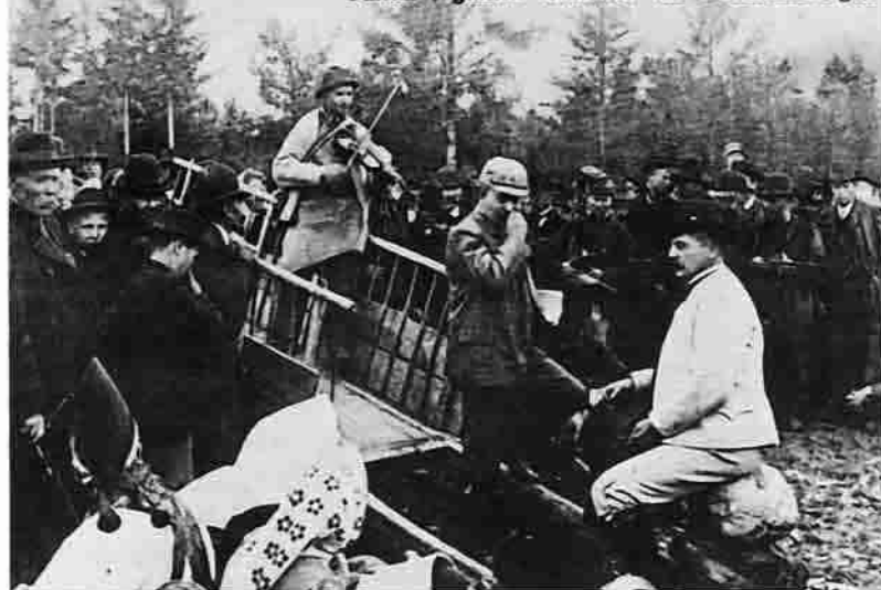
Den första spelmanstävlingen skedde under enkla former, en skrinna utgjorde scenen. Anders Zorn sittande till höger. Två kort från 1906.

Den gamla spelmansmusiken hade i praktiken förlorat sin funktion i samhället. Modernare instrument hade ersatt fiol och nyckelharpa och samma sak var det med fåbod-musiken – hornblåsandet behövdes inte längre. Detta är bakgrunden till Anders Zorns initiativ till en tävling för hornblåsare och spelmän på Gesundaberget den 1 september 1906. Han hade under en resa i Dalarna år 1905 saknat de hornlåtar han tidigare hört ljuda från fåbodarna. Det visade sig att konsten att blåsa horn var på väg att försvinna. Tävlingen utlystes i Mora. Föddning 32 spelmän fördelade på fiol, kohorn och bockhorn, anmälde sig. Arrangemanget var enkelt men uppmärksammades stort. DN skrev