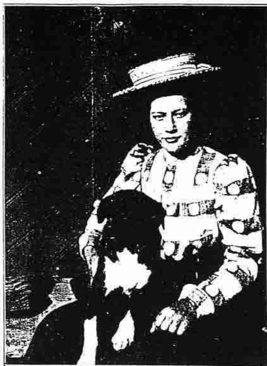
Bondpiga för 20 år sedan. Gåsinge.

rå de inte med ett strumpskafat fullt med spannmål ens, förklarade Persson med verklig övertygelse, men vem kan få några krafter av att äta bara havrebröd.