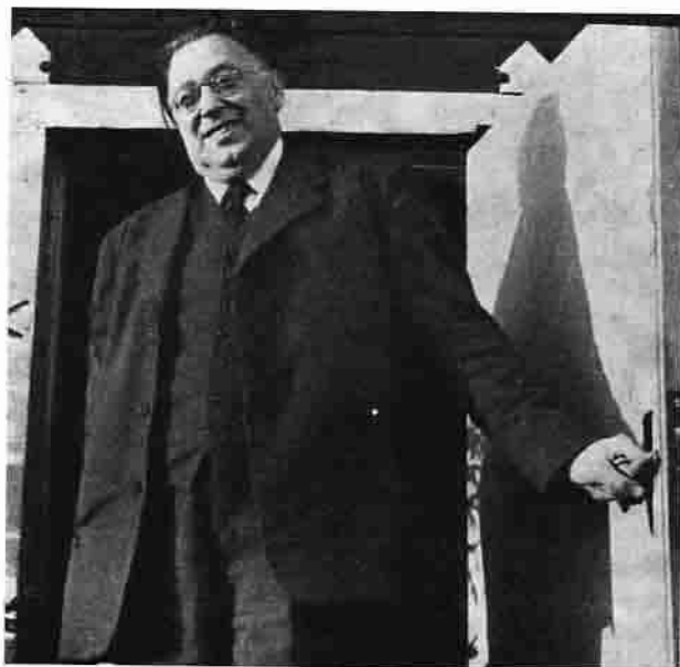
Flenmon håller alltid dörren öppen för Sörmlands spelmän!

Inget annat land i världen har offrat så mycket pengar på uppteckning och publicering av folkmelodier som vårt lilla land. Det ska vi svenskar, och särskilt då vi spelmän vara tacksamma för. Men det är inte meningen, att dessa låtar ska ligga arkiverade. Det är i stället meningen att de ska levandegöras genom att spelas och sjungas. Då först blir denna vår tonskatt rätt förstådd och rätt uppskattad. Nu blåser frisk medvind för spelmansförbunden och spelmansgillena i vårt land, och folkmusiken ljuder från fioler nyckelharpor, klarinetter, bockhorn och spilopipor från Skåne upp till Lappland. I den stora orkestern är vi sörmländska spelmän endast en ringa del. Vi sörmlänningar är glada över att vi var de första, som insåg betydelsen av samarbete och organisation spelmännen emellan. Under 25 år har nu vårt förbund varit verksamt till fromma för den sörmländska folkmusiken. Jag är övertygad om att vårt förbund kommer att bestå i framtiden, ty det arbetar ju för ett så vackert och ädelt mål: Den Svenska Folkmusiken. Tag bort den från vårt kulturella arv! Då vore det, som om regnbågen skulle mista en av sina färgnyanser. Vi äger i vårt land en stor skatt i vår folkmusik, en skatt, som är oåtkomlig för rost och mott och mal och som ska bestå, så länge som det nationella Sverige består. Förvalta den skatten väl, kära spelmän, och Ni alla andra folkmusikens vänner och gynnare!